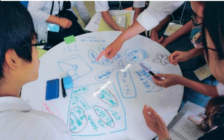
まちづくりへの想い、ふくらむアイデア